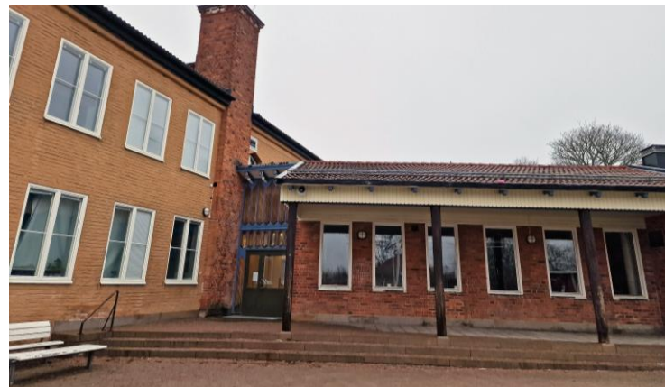
Berga anpassad grundskola åk 1-6