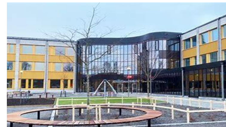
Branting anpassad grundskola åk 7-9