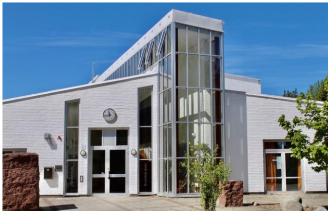
Östra Stenhagen anpassad grundskola åk 1-6 Även åk 7-9 för elever med flerfunktionsnedsättning