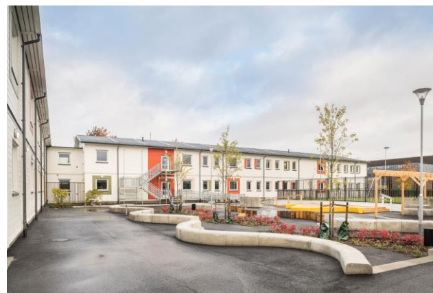
Gottsunda anpassad grundskola åk 7-9