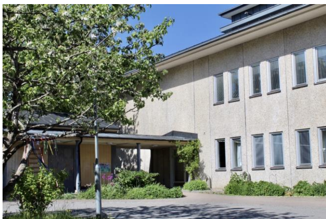
Årsta anpassad grundskola åk 1-6 Även åk 7-9 för elever med flerfunktionsnedsättning