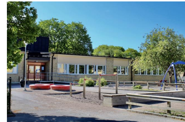
Johannesbäck anpassad grundskola åk 1-6